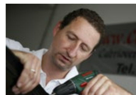
Perfektionist. Bis ins kleinste Detail.