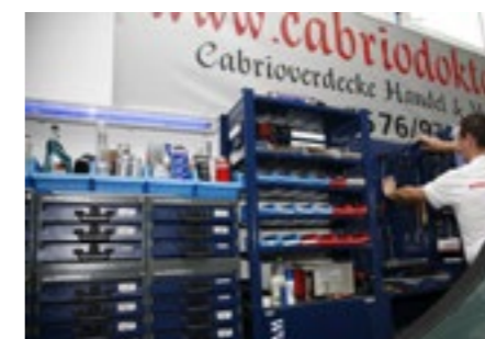
Aufgeräumt. Die Eventwerkstatt.