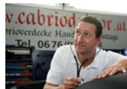
Der Cabriodoktor. Stellt die Diagnose.